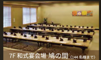
7F 和式宴会場 鳩の間 (144名様まで)