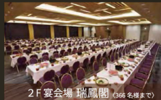
2F 宴会場 瑞鳳閣 (366名様まで)